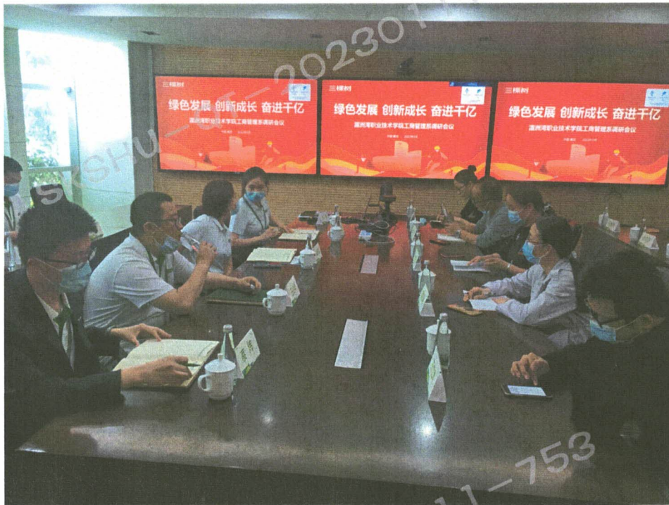
工商管理系领导和现代物流管理、市场营销专业教师到三棵树调研